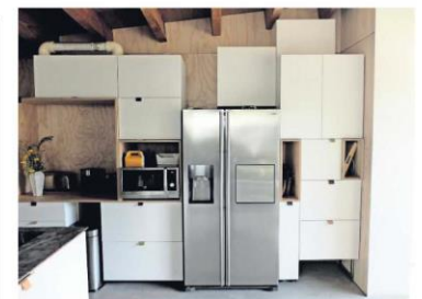
▲ De keukenkastjes: zelf bedacht mét behulp van Ikea-spullen.

Die centrale witte zuil oogt voor de passant als een zwaar betonblok, maar is verrassend genoeg opgebouwd uit een houtskelet. Dat maakt de constructie licht, hoewel op de omringende omloop vele tonnen aarde zijn gestort om daar heidegroei mogelijk te maken.